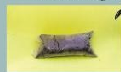
Caribbean Drip Soil Mix AWG 15,00